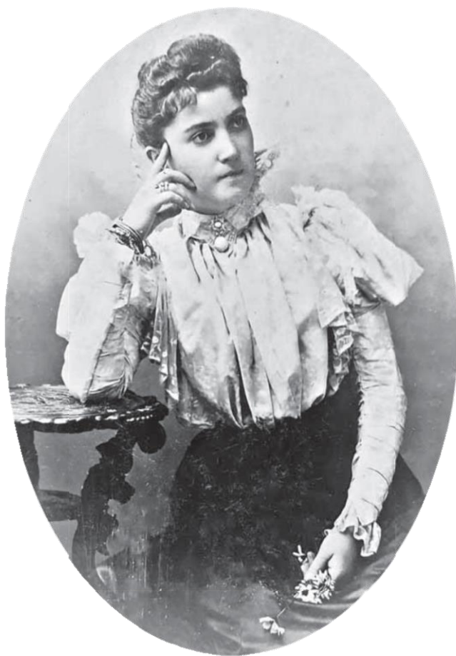
СЛИКА 1. Драгиња П. Луђевица (Горњи Милановац, 23. септембар 1867. – Београд, 29. мај 1903). Била је зналац више страних језика, писац, преводилац и новинар, пијанисткиња и играчица, бавила се цртањем и креирањем, пливањем и јахањем... Њен живот, како је и сама записала, одвијао се у матичњаку са седам ћелија: Породична – везана за Милићево Луђевице; Духовна – за Српску православну цркву и Рафаиловиће; Учевна – за школе, књижевност и уметност; Нехотећа – за инжењера Машина; Родољубна – за Србију; Судбинска – за краља Александра, и ИСТОРИЈСКА – за династију Обреновић. Токове развоја и промена ћелија Драгиног живота, ова књига прати и, испраћа

лова садржи познате, а и необјављиване слике, илустрације, обрађене податке о фамилијама из лозе Милићевића/Луђевице, Рафаиловића, Негојевића и Обреновића из оба „баба“ Вишњина брака. Књишка поглавља подједнако прате Драгињин и живот краља Александра, њихову младост, одрастање и образовање, путешествија, удаје и женидбе, кумства, успоне и посрнућа.